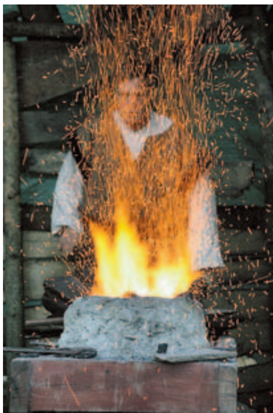
Smed. Vikingene var dyktige håndverkere, og er innblikk i håndverkstradisjonene får man ved å besøke Midgard historisk senteres vikingmarked som arrangeres hver sommer i juli.