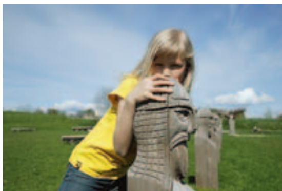
Majestetisk profil. Med barskt utseende vokter trevikingene over historien.