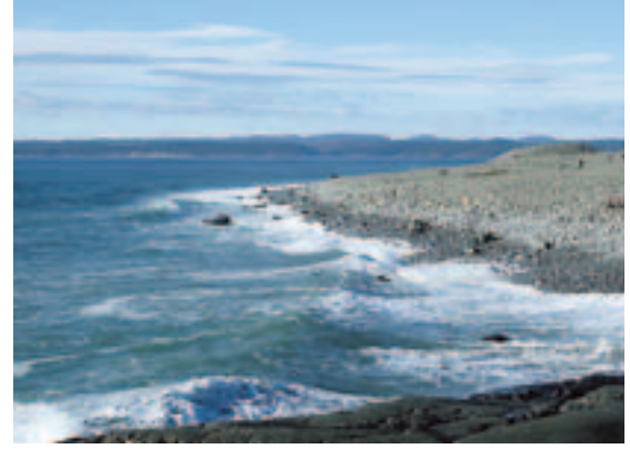
Mektige steinrøyser. På Brunlanes der det store Vestfoldraet forsvinner i havet, ligger en stor samling av mektige steinrøyser fra vikingtiden. Stedet er en imponerende opplevelse på varme sommerkvelder.