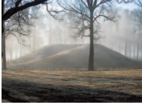
Mytisk virkelighet. Fortsatt jakter arkeologene på skjulte hemmeligheter i Borrehaugene.