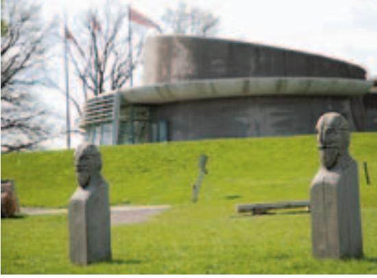
Opplevelsessenter. Midgard historiske senter er Vestfolds mest spennende vikingattraksjon.