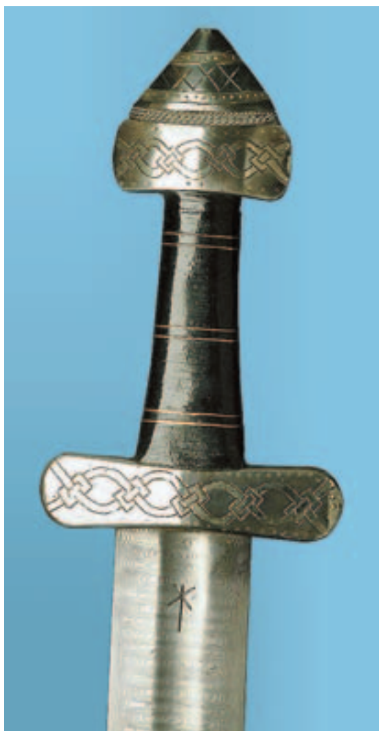
Vakkert kunsthåndverk. Et vikingsverd var mer enn bare et våpen. Utsmykningen har karakteristiske knuteornamenter, kjent som Borrestilen.