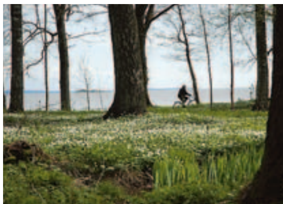
Vakkert vikinglandskap. Man trenger ikke være historiefanatiker for å kunne kose seg i Borreparken.