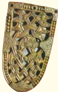
Foto: Funngjenstander fra skipsgraven